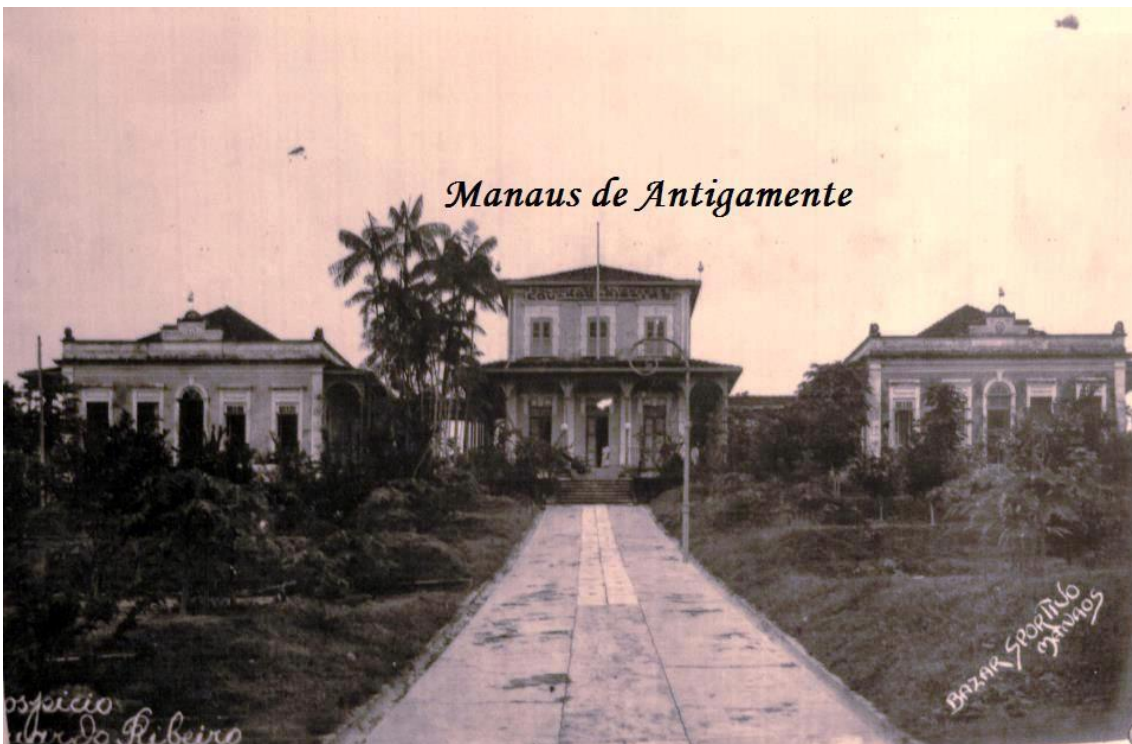
Imagem 2: Foto da Chácara O Pensador antes da instalação do Asilo de Alienados