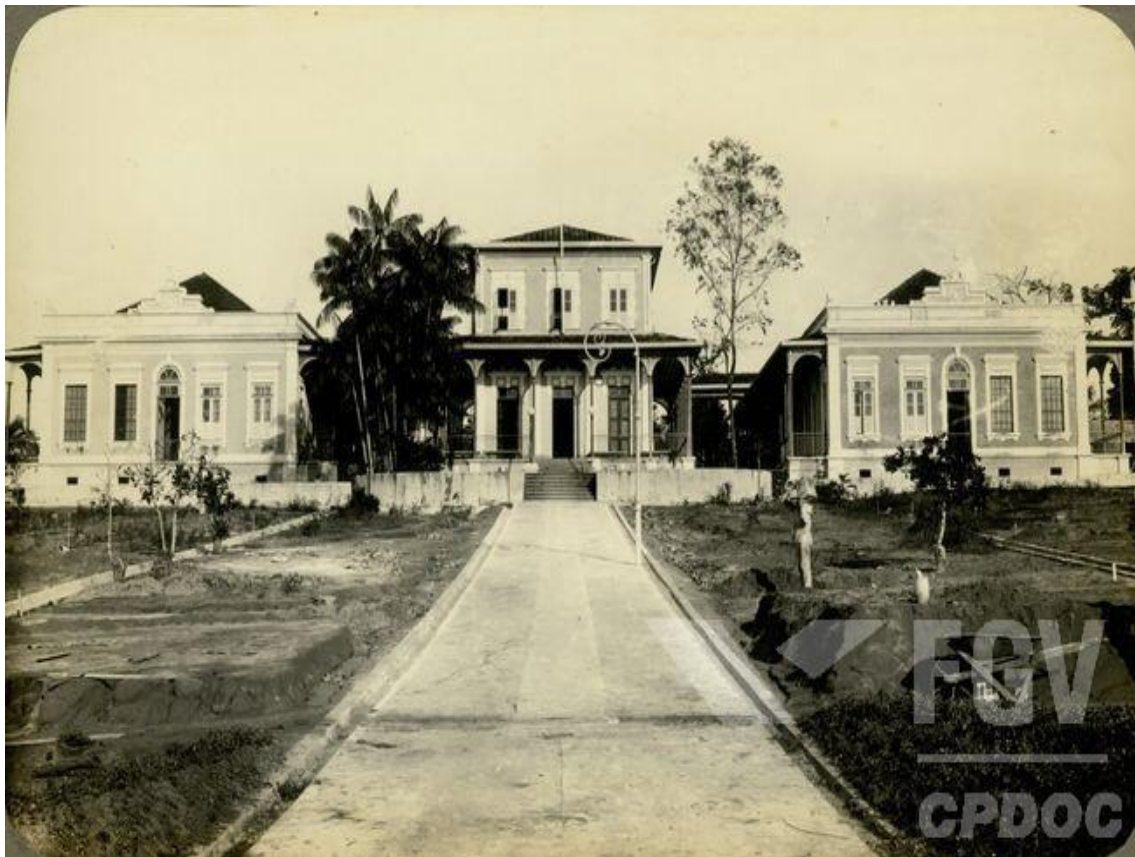
Imagem 3: Foto da fachada da Chácara O Pensador, ano de 1930.