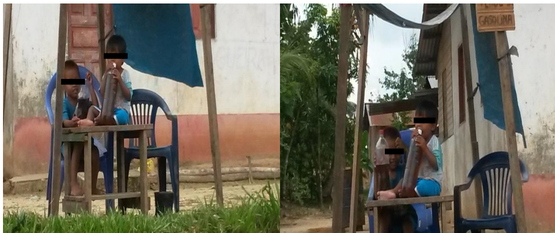
Figura 10 - Crianças tikunas desacompanhada dos pais na venda ilegal de combustível/Comunidade Umariçu I.