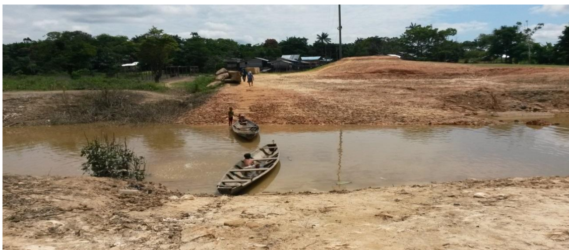
Figura 5: Crianças tikunas realizando a travessia de pessoas em canoas

Fonte: registro do pesquisador. Comunidade indígena Filadélfia, Benjamin Constant, 2014.