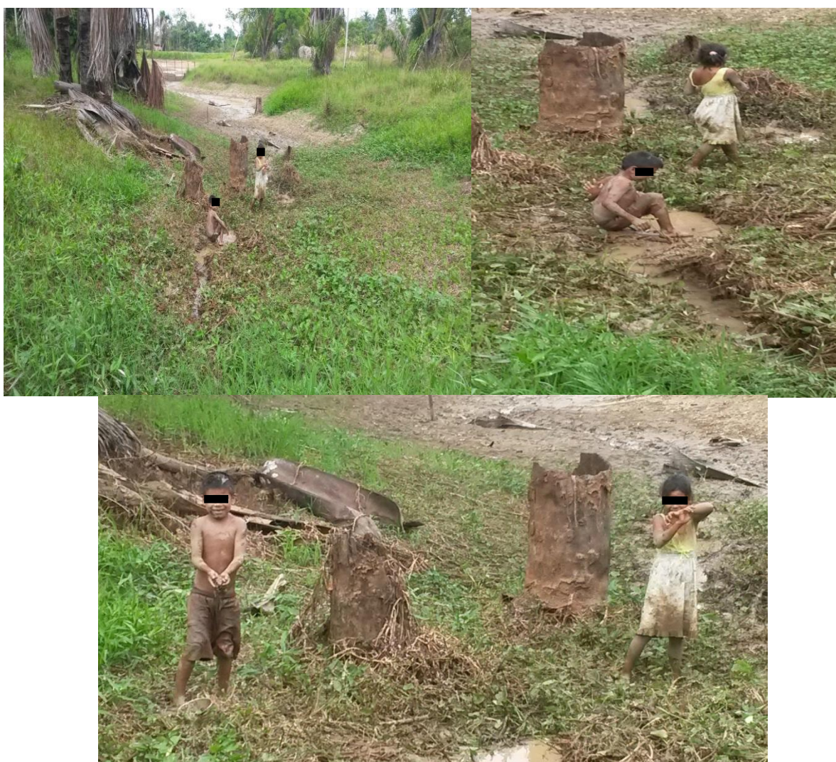
Figura 6: crianças tikunas resgatando peixes no lago que secou

Fonte: registro do pesquisador. Comunidade indígena Filadélfia, Benjamin Constant, 2014.