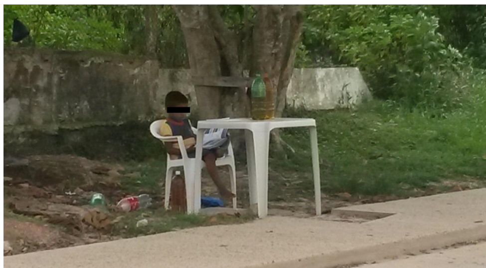
Figura 9 – Criança desacompanhada dos pais na venda ilegal de combustível, na rua Ante Tamandaré, ao lado da Capitania dos Portos, Tabatinga.