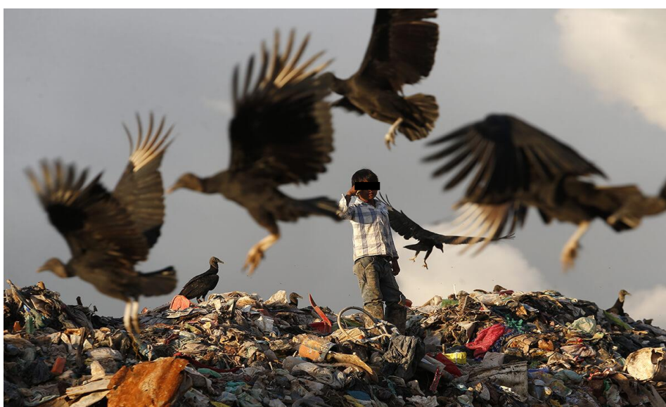
Figura 7: Criança tikuna no lixão municipal de Tabatinga/AM