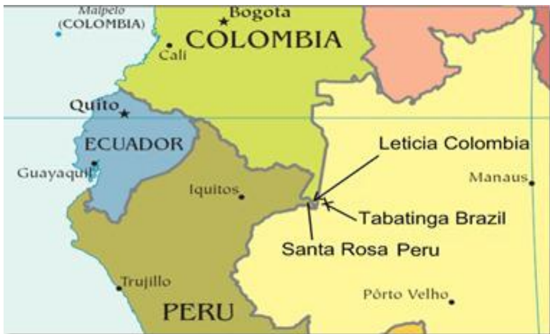
Figura 1 - Tríplice fronteira Tabatinga-Brasil, Letícia-Colômbia e Santa Rosa – Peru

Hodiernamente, o Brasil, em sua configuração territorial possui fronteira com diversos países da América do Sul, devido a sua grande extensão territorial. Na Mesorregião Sudoeste do Estado do Amazonas, na Microrregião do Alto Solimões 21 , localiza-se a cidade de Tabatinga em uma área de Tríplice Fronteira, estando conurbada com a cidade de Letícia, no Departamento da Amazônia colombiana e fazendo limite com a Comunidade de Santa Rosa, localizada no Departamento peruano de Loreto, da qual é separada apenas pelo Rio Amazonas-Solimões.