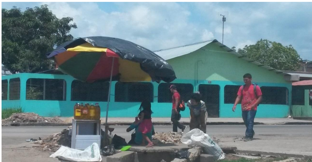
Figura 8 – Criança na companhia dos pais na venda ilegal de combustível na rua Santos Dumont, Tabatinga