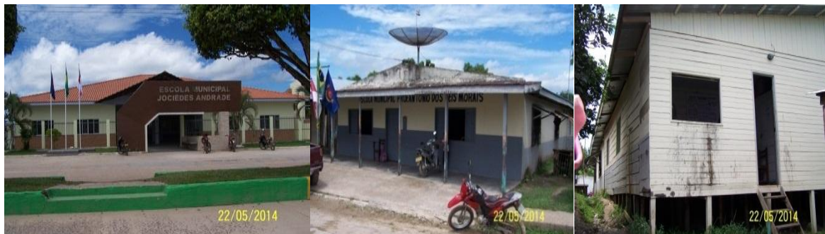
Figura 2 – Escolas da rede municipal de ensino de Tabatinga/AM

No aspecto estrutural, as escolas estaduais do perímetro urbano, destinadas à educação de crianças e jovens, apresentam-se bem estruturadas. Por outro lado, as escolas municipais, poucas passaram por reformas, outras ainda são de madeira, conforme se verifica os estabelecimentos educacionais em registro fotográfico: