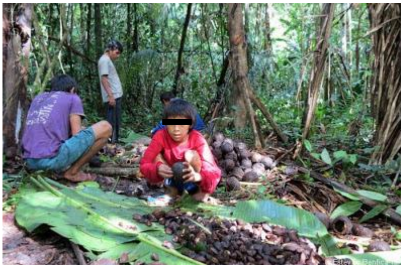
Figura 11 – Trabalho infantil indígena na atividade extrativista