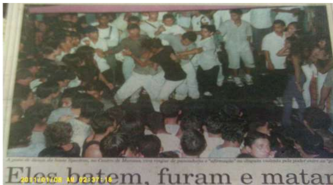
Fig 3. Foto de primeira página do jornal A Crítica, de 29/11/1998. A legenda diz: A pista de dança da boate Spectron, no Centro de Manaus, vira ringue de pancadaria e “afirmação” na disputa violenta pelo poder entre as “galeras”.