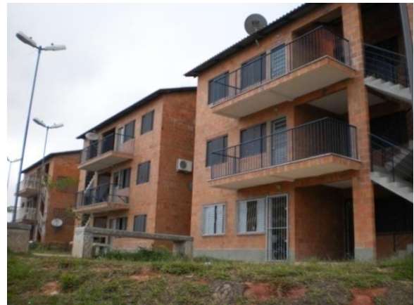
Figura 10: Modelo de pavimento único.

A reinstalação das atividades econômicas é componente do processo de reassentamento e integra um dos princípios do BID referente à reabilitação dos moradores de unidades habitacionais em Quadras-Bairro. Entre as soluções previstas estão: a indenização (para as atividades formal e informal), o Convênio para operações de crédito com a Agência de Fomento do Estado do Amazonas (AFEAM) e o apoio à inclusão social, com empreendedorismo e formação de associações comerciais. Através de parcerias com a Universidade do Estado do Amazonas (UEA), o Instituto Federal do Amazonas (IFAM), a UGPI, entre outros, são promovidas as atividades de capacitação e geração de renda: curso de camareiras, alfabetização de adultos, curso de informática, curso preparatório para vestibular, curso de higiene pessoal e manipulação de alimentos, etiqueta urbana, oficinas para qualificação e geração de renda, curso de orientação nutricional e reaproveitamento de alimentos (A experiência..., 2010).