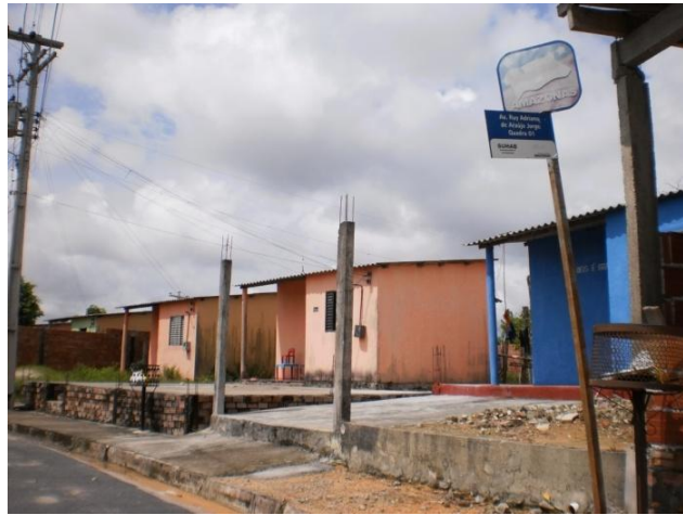
Figura 08: Casas do Conjunto João Paulo II.