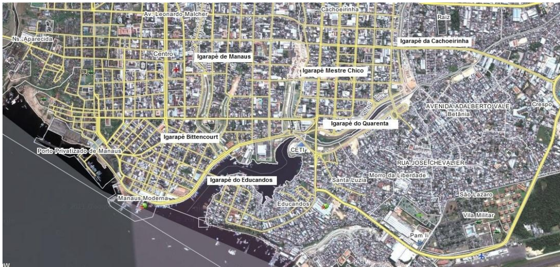
Figura 02: Localização de Igarapés.

A primeira etapa do Prosamim priorizou a bacia Educandos-Quarenta e seus afluentes – Igarapé de Manaus, Igarapé Bittencourt e Igarapé Mestre Chico. O custo total foi orçado em US$ 200 milhões de dólares americanos, sendo US$ 140 milhões financiados pelo Banco e US$ 60 milhões de contrapartida do GEA. O PRM foi uma das soluções de reassentamento oferecidas pelo Estado aos habitantes das áreas de abrangência do Programa. Em troca da antiga moradia, a ser desocupada e destruída, eles podiam escolher entre algumas formas de indenização em dinheiro, casas em conjuntos habitacionais (de programas de habitação do GEA) ou apartamentos em unidades habitacionais – como o PRM, por exemplo.