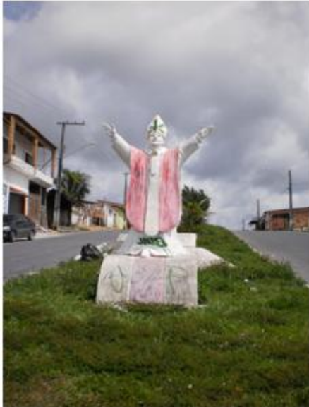
Figura 07: Entrada do Conjunto João Paulo II.

a existência em um espaço, quanto em um estilo de vida. Elas assinam um termo de posse no qual se comprometem a não vender, ceder, alugar ou emprestar o imóvel por, no mínimo, dez anos.