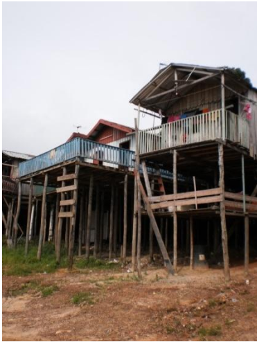
Figura 04: Palafita