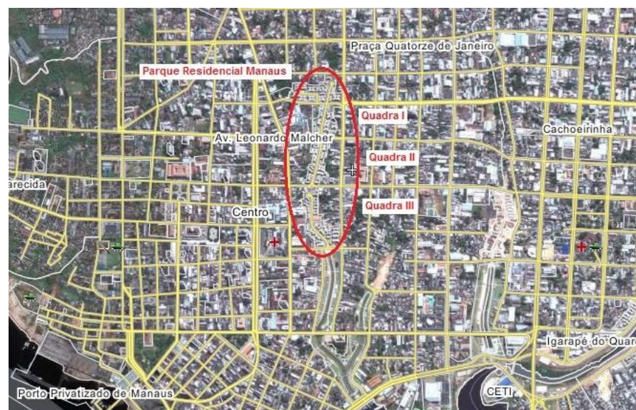
Figura 01: Localização do PRM.

Em geral, os trabalhos acadêmicos que abordam a temática (Azevedo, 2006; Barbosa, 2008; Carvalho, 2009; Pinheiro, 2008; Souza, 2006) detêm-se nos efeitos do Prosamim, na produção de uma nova configuração do espaço urbano, ou no processo de desenraizamento social que preside sua implementação. Aqui, ao contrário dos estudos acima, examino as iniciativas de difusão desse novo comportamento, manifesto no suporte para readaptação das famílias, e expresso na promoção de práticas de normalização das convivências entre vizinhos e com o meio ambiente. Tais iniciativas compõem a denominada etapa de acompanhamento pós-reassentamento do Prosamim, cujo escritório administrativo, com equipe multidisciplinar de técnicos do GEA, localiza-se na unidade habitacional mais antiga, construída no âmbito do Programa: o Parque Residencial Manaus (PRM).