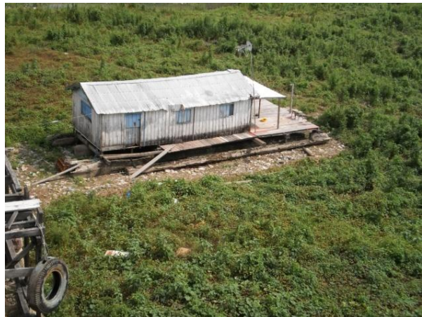
Figura 05: Flutuante

O momento seguinte é o do prefeito Alfredo Nascimento (1997-2004) com a tentativa do Projeto Nova Veneza (PNV). O objetivo dele era intervir no Igarapé de Manaus, no Centro, mas o projeto não foi levado adiante. Mais tarde, algo semelhante seria proposto com o Prosamim. Nas entrevistas e conversas com ex-moradores de vários igarapés, verifiquei que parte da não aceitação inicial ao Prosamim se deu por causa da promessa não cumprida de execução do PNV. Quem via nesse tipo de programa a possibilidade de melhoria de moradia frustrava-se. “Ninguém acreditava mais”, repetia-me dona Mariana, ex-moradora do Igarapé Mestre Chico, inserida no Prosamim. E o quarto momento é caracterizado pelo governo estadual de Eduardo Braga (2003-2010), seguido pelo de Omar Aziz (2011-2014), e pelo cumprimento da promessa com as intervenções do Prosamim.