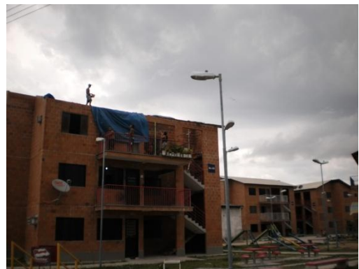
Figura 12: Destelhamento PRGM.