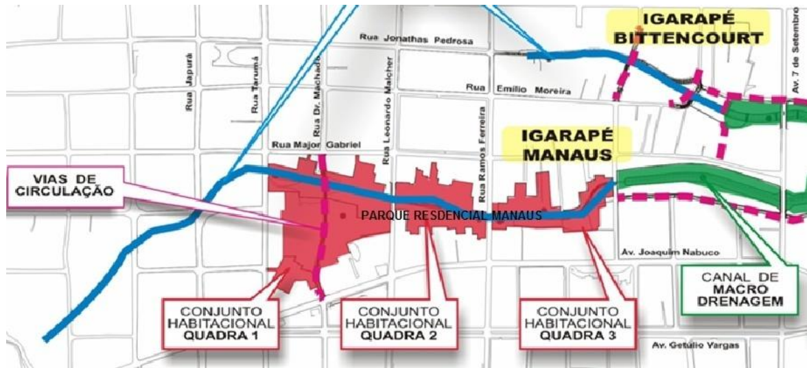
Figura 03: Localização das Quadras do PRM.

O PRM é a única unidade habitacional que conta com uma base administrativa do Estado em seu espaço, o Escritório de Sustentabilidade Socioambiental e Gestão Compartilhada (ESGC), que é conhecido como o escritório da Unidade de Gerenciamento do Programa Social e Ambiental dos Igarapés de Manaus (UGPI). A UGPI é o órgão gerenciador do Prosamim, e interlocutor com o BID. Parte de sua equipe multidisciplinar de técnicos, formada por assistentes sociais, psicólogos, nutricionista e biólogos, trabalha no ESGC em contato quase diário com os moradores do PRM. Essa equipe é responsável pela etapa de pós-reassentamento.