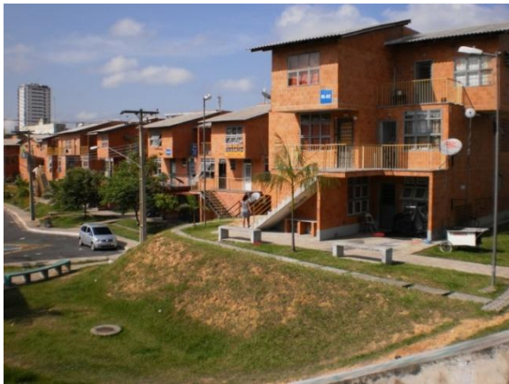
Figura 09: Modelo duplex.

de 56m 2 distribuídos em sala, quartos, cozinha, banheiro e área de serviço. Mas, como os moradores dessas primeiras unidades habitacionais indicaram alguns problemas, esse modelo não foi mais adotado no PRGM. A perda de área útil da sala com a escada de acesso aos quartos, além das dificuldades de adaptação com os quartos em piso diferente do banheiro, e com o lavabo fora deste, são alguns dos pontos de insatisfação. Assim, o segundo tipo conta com blocos de casas com um pavimento, em um prédio de dois andares e térreo.