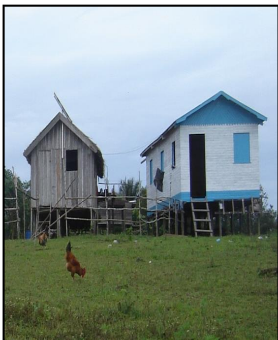
Imagem 04 – Casas de madeira, tipo de moradia ribeirinha.

A maioria das casas são suspensas devido às inundações. Durante a seca, a parte inferior deste tipo de moradia serve de abrigo para os animais domésticos (Figura 4). Outro tipo de moradia comum no local são os flutuantes que se locomovem conforme o período hidrológico do rio. São habitações construídas sobre troncos de madeira açacu, que servem de bóias que flutuam, sustentando assim, a casa sobre a água (Figura 5).