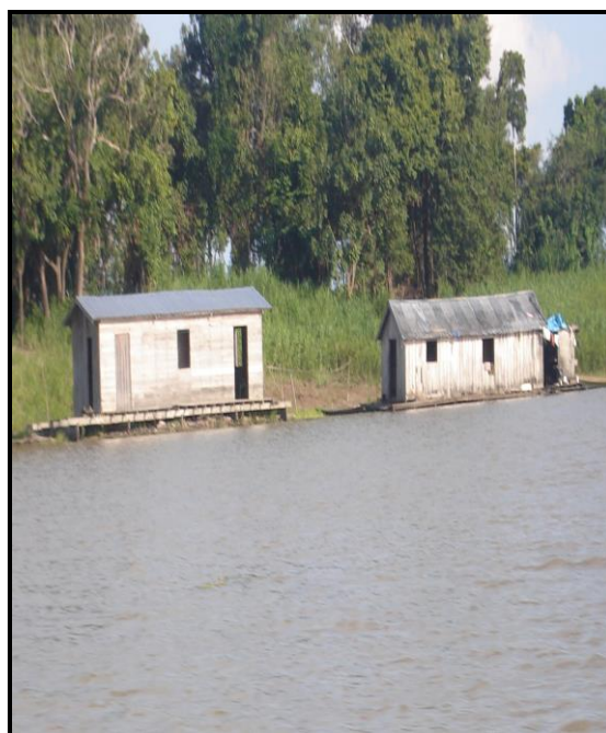
Imagem 05 – Flutuante, tipo de moradia ribeirinha.