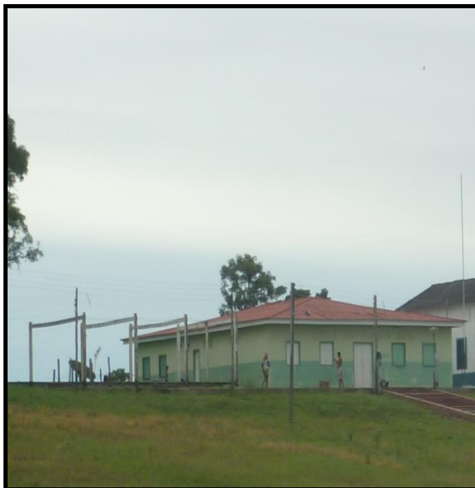
Imagem 07 – Escola Estadual José Augusto de Queiróz.

Hoje, as escolas, em relação a tempos anteriores, apresentam melhores condições atendendo a um bom número de alunos em sala de aula (Figura 7). O horário de funcionamento das aulas compreende o período matutino e vespertino. Para os moradores, a implantação desse projeto em Jaiteua superou várias dificuldades, como a não permanência dos jovens em suas respectivas comunidades. Quando os adolescentes e jovens concluíam o ensino fundamental oferecido pelas escolas locais, era necessário a locomoção para outro lugar para dar continuidade aos estudos, migrando para Manacapuru ou Manaus.