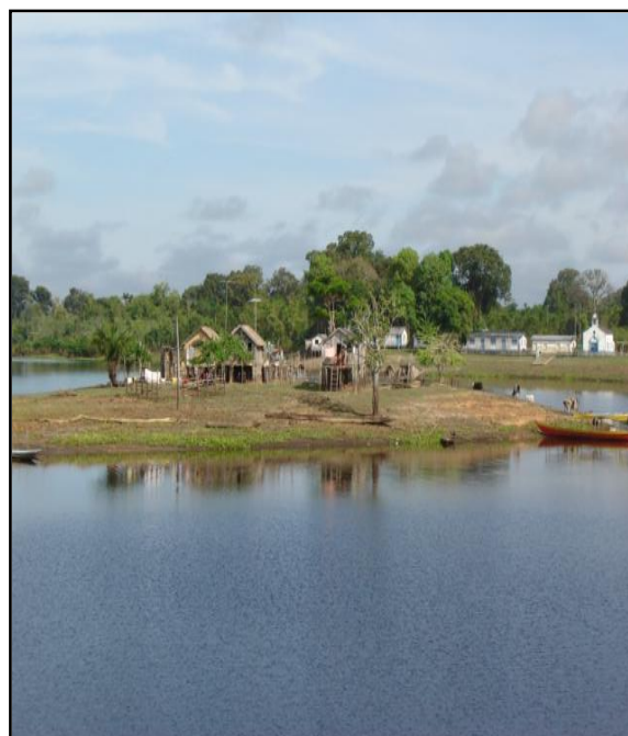
Imagem 13 – Vista parcial de como se configura o território de Nossa Senhora do Perpétuo Socorro.

A comunidade Nossa Senhora do Perpétuo Socorro é composta por aproximadamente 50 famílias. Sua infraestrutura é constituída por um centro social, uma casa para os professores que serve como moradia durante o ano letivo, uma escola, um campo de futebol, um motor de luz, um barco para levar e buscar alunos que moram mais afastados e as Associações de Moradores, de Pais e Mestres e Agricultores.