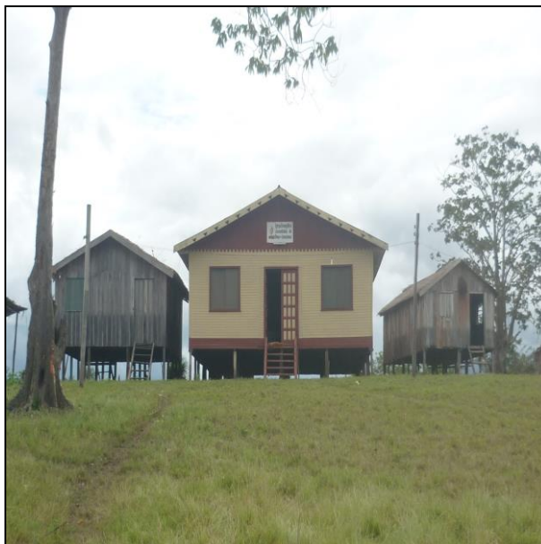
Imagem 14 – Comunidade Assembléia de Deus.