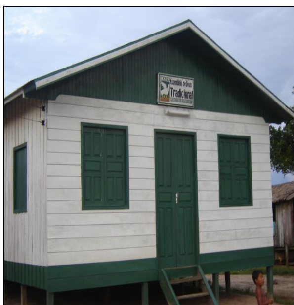
Imagem 15 – Igreja Assembléia de Deus Tradicional.

A saída em definitivo da Assembléia de Deus para outro local acarretou também a saída de alguns moradores para outro lugar e os que não tinham pra onde ir tiveram que ficar, pois não puderam abandonar suas casas, por isso resolveram aderir ao sistema religioso da Assembléia de Deus Tradicional.