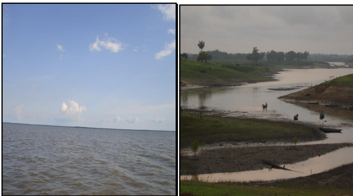
Imagem 02 – Vista parcial do Lago Grande.

A localidade Jaiteua de Cima é uma região exuberante por causa da diversidade em fauna e flora que lá se concentram, estes recursos naturais são as principais riquezas dos moradores locais (Figura 3). Tudo o que este ecossistema produz é aproveitado de maneira eficiente.