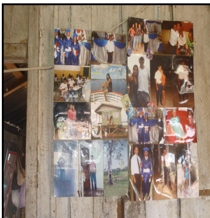
Imagem 06 – Fotos fixadas na parede de uma sala.

Nestas residências quase não existem móveis. Na sala de algumas casas há televisão, a qual é um meio de entretenimento quando toda a família está em casa para assistir somente o jornal e a novela à noite; todos se reúnem em torno da TV. Uns deitados na rede, outros deitados no chão ou sentados. Com a adequação de novos equipamentos, a sala também é utilizada para acomodação do motor de popa, da roçadeira e de outras ferramentas de trabalho. Nas paredes das salas está registrada através dos quadros, fotos com momentos que marcaram a vida dessa população, como a formatura de um filho, de parentes que já faleceram, a passagem de alguma autoridade política pela comunidade, festas, casamentos, etc. Além disso, há também espelhos, imagens de santos católicos e o calendário registrando a passagem do tempo (Figura 6).