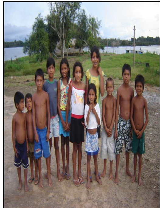
Imagem 09 – Crianças da Com. Ass. de Deus Tradicional.

O futebol é uma das atividades de lazer mais desenvolvida. Crianças – brincam depois que chegam da escola –, jovens e adultos se divertem na prática do futebol através de torneios