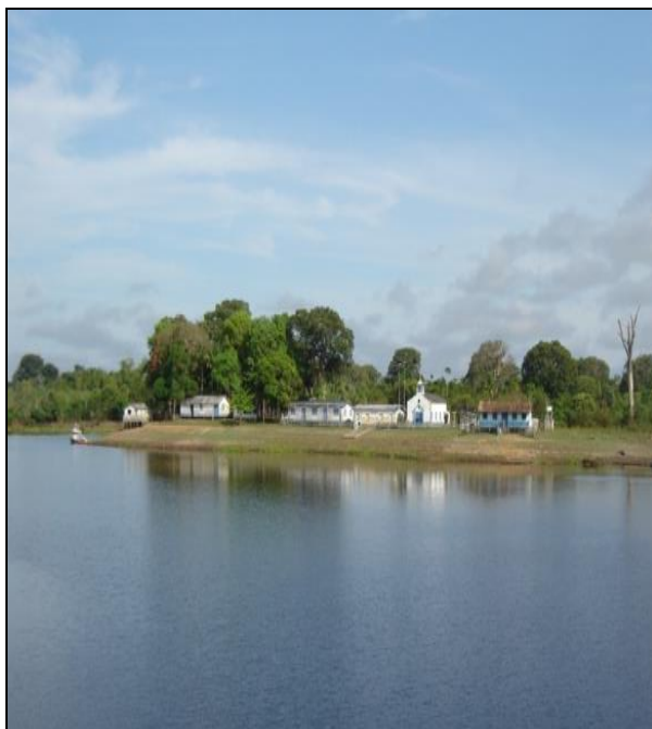
Imagem 12 – Centro da comunidade Nossa Senhora do Perpétuo Socorro.