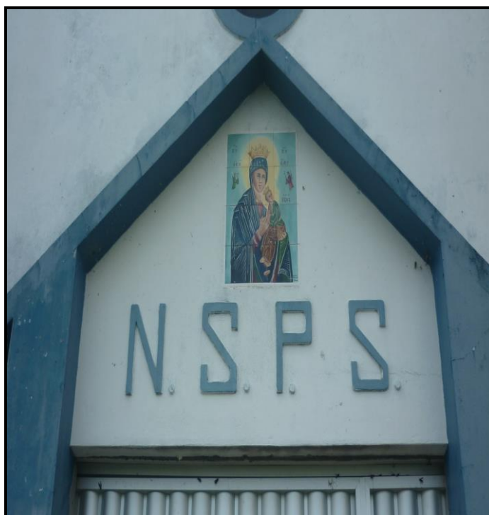
Imagem 11 – Imagem de Nossa Senhora do Perpétuo Socorro no alto da capela local.

A imagem de Nossa senhora do Perpétuo Socorro na altura da capela local, trata-se de uma pintura do século XII, de estilo bizantino (Figura 11). Na pintura, esta santa tem um semblante melancólico e triste, trazendo no braço esquerdo o menino Jesus. Os anjos Gabriel e Miguel apresentam a ele quatro cravos e uma cruz. Ela é considerada a senhora da morte e a rainha da vida, o auxílio dos cristãos, o socorro seguro e certo dos que a invocam.