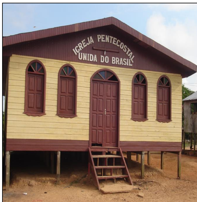
Imagem 16 – Igreja Pentecostal Unida do Brasil.

De acordo com informações, a comunidade foi consolidada depois da compra do terreno onde está concentrada. Esta legitimação se deu com a aquisição de recursos monetários de uma festa que se realizava todos os anos na comunidade Nossa Senhora do Perpétuo Socorro. Ação que partiu de um dos coordenadores da festa, proporcionando alteração entre os moradores. Os moradores de Nossa Senhora do Perpétuo Socorro dizem que o terreno onde está a comunidade Santa Izabel deve este recurso aos mesmos, uma vez que nunca foi devolvido aos promotores da festa, os quais usavam tal recurso para investir na comunidade promotora do evento.