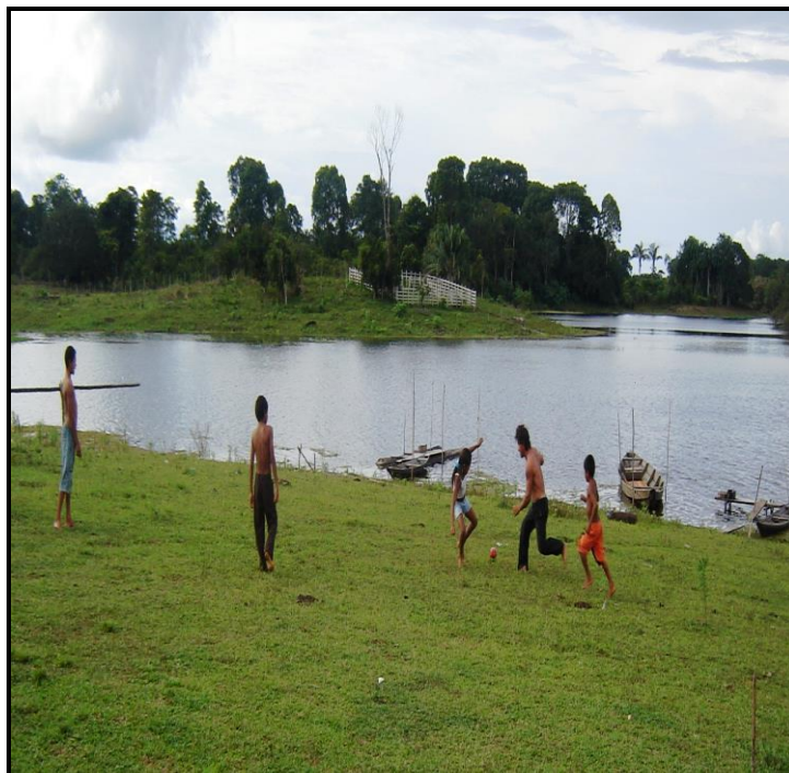
Imagem 10 – Momento de lazer.

e peladas no final da tarde. Os moradores da comunidade Nossa Senhora do Perpétuo Socorro realizam torneios, principalmente nos finais de semana, valendo refrigerantes, dinheiro ou bombons. Outras vezes, participam de torneios em comunidades vizinhas.