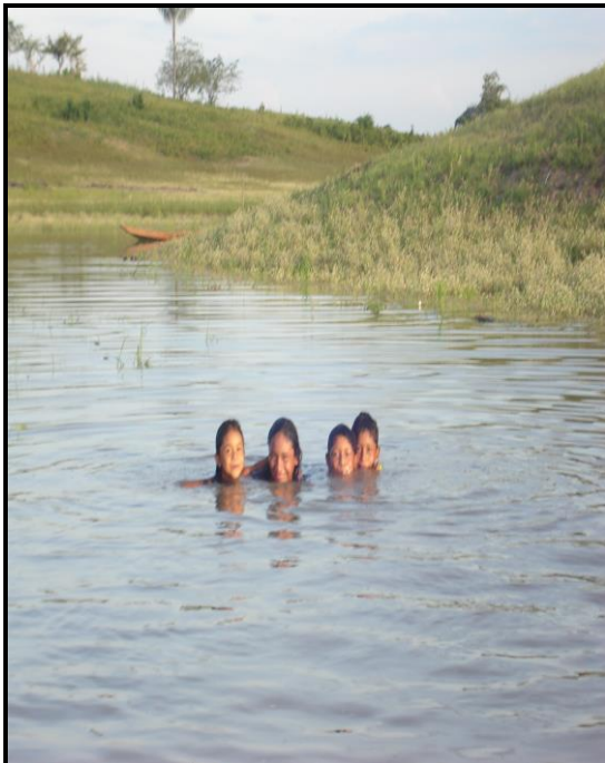
Imagem 08 – Crianças brincando no igarapé.

Todas as vezes que eu chegava na comunidade Assembléia de Deus Tradicional, rapidamente formava-se um aglomerado de crianças curiosas e risonhas que queriam tirar uma foto e ouvir meu diálogo com os moradores mais velhos. Outras já faziam várias interrogações, ou simplesmente queriam saber quem era a pessoa que estava na comunidade (Figura 9).