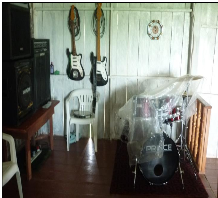
Imagem 18 – Equipamentos musicais, da igreja Evangélica Assembléia de Deus.