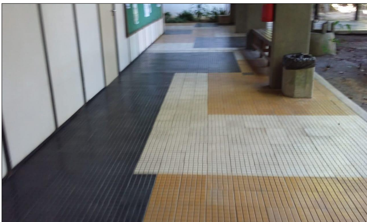
Figura 4 – Pisos sem Elementos Táteis - II