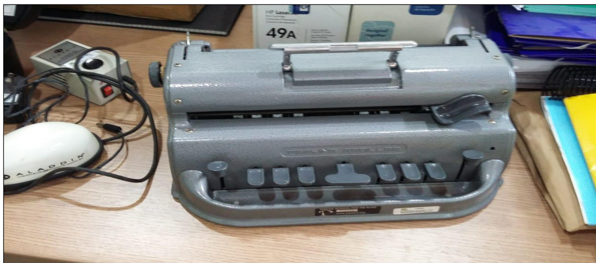
Figura 2 – Máquina de Datilografia em Braile.