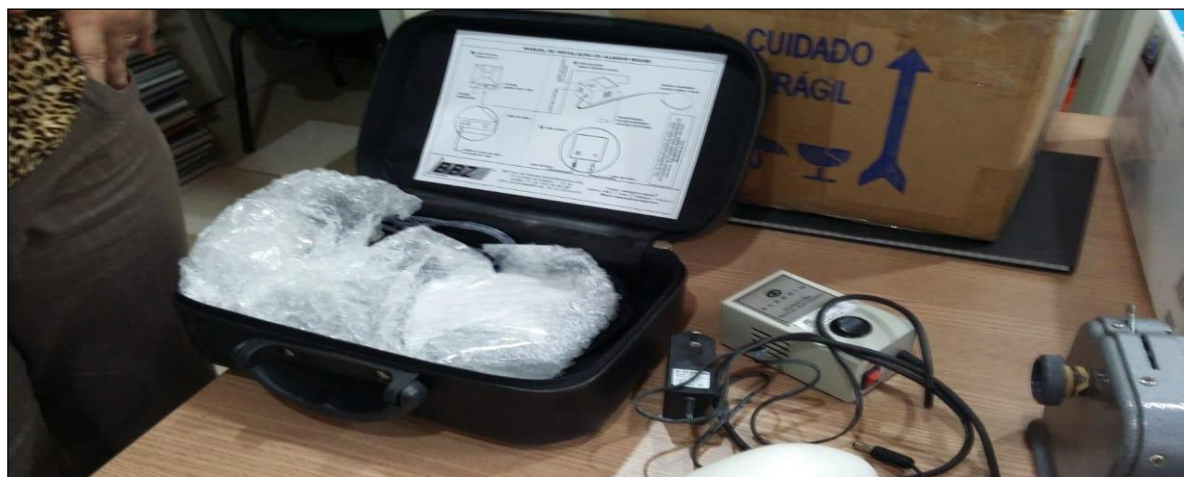
Figura 1 – Equipamentos de Inclusão